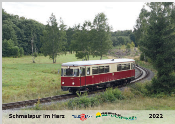
Schmalspur-Kalender 2022 Narrow-gauge calendar 2022