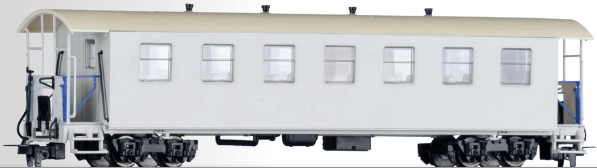
FORMNEUHEIT: Personenwagen KBtr mit Traglastenabteil der HSB NEW: Passenger coach KBtr of the HSB