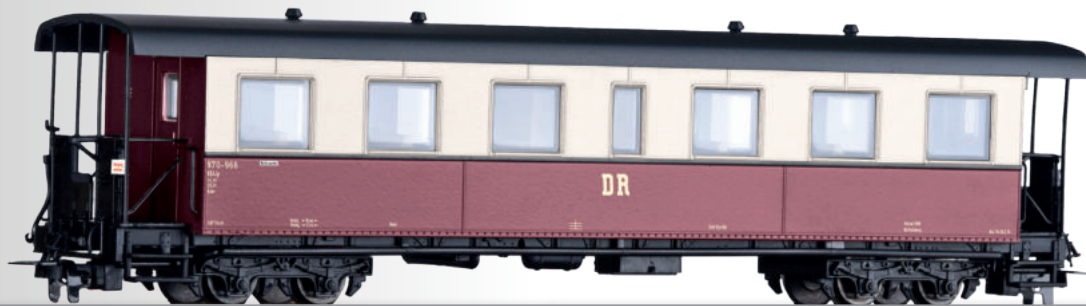
Personenwagen KB4ip der DR Passenger coach KB4ip of the DR