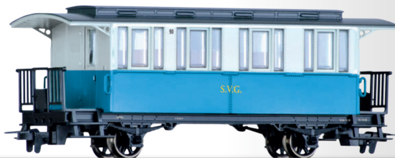
Personenwagen der Sylter Inselbahn Passenger coach of the Sylter Inselbahn