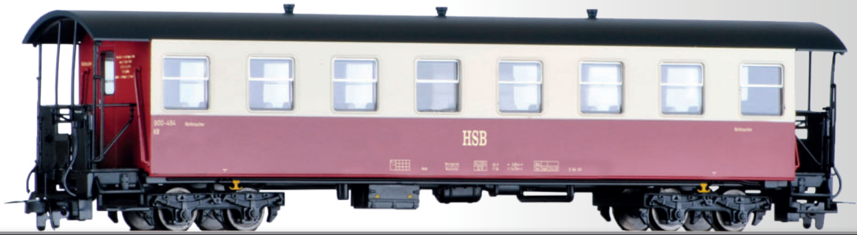
Personenwagen KB der HSB Passenger coach KB of the HSB