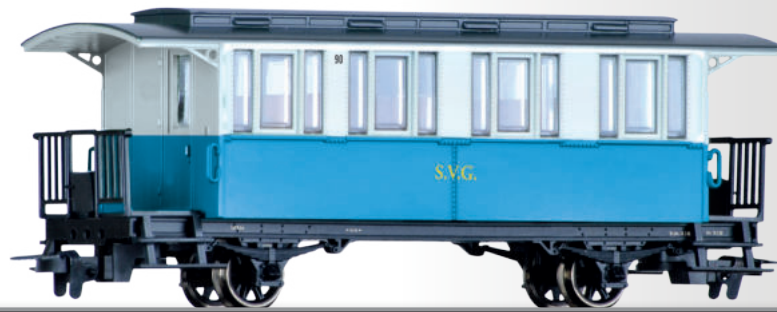
Personenwagen der Sylter Inselbahn Passenger coach of the Sylter Inselbahn