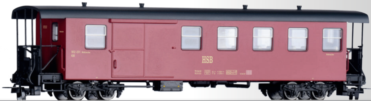
Packwagen KBD der HSB Baggage car KBD of the HSB