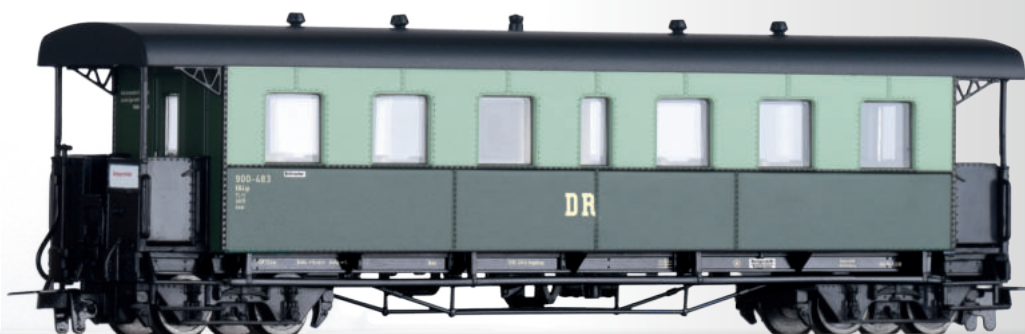
Personenwagen KB4ip „Harzer Roller“ der DR Passenger coach KB4ip „Harzer Roller“ of the DR • Ergänzung zu / Additional to 01174