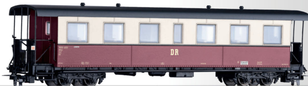
Personenwagen KB4ip der DR Passenger coach KB4ip of the DR