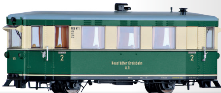
Triebwagen VT1 der NKB Rail car VT1 of the NKB