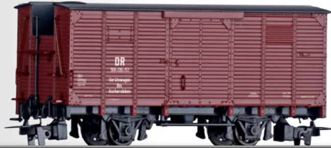
Gerätewagen der DR Service car of the DR