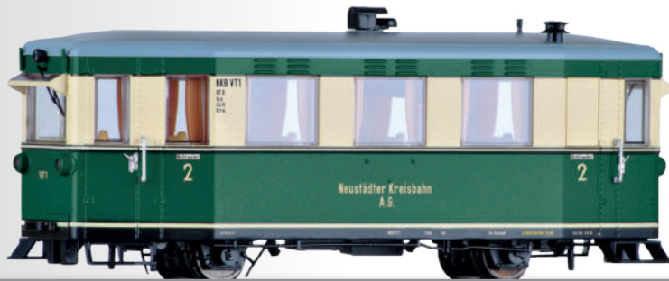
Triebwagen VT1 der NKB Rail car VT1 of the NKB