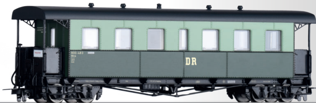
Personenwagen KB4ip „Harzer Roller“ der DR Passenger coach KB4ip „Harzer Roller“ of the DR • Ergänzung zu / Additional to 01174