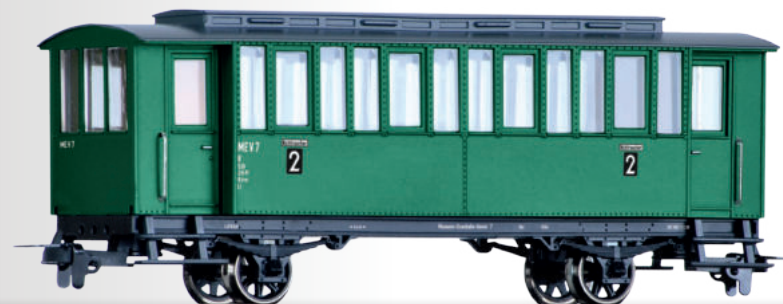
Personenwagenset einer Museumsbahn, bestehend aus drei Personenwagen Passenger coach set of the Museumsbahn with three passenger coaches