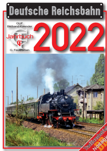
DR-Kalender 2022 DR calendar 2022 (Feuerrißen Verlag)