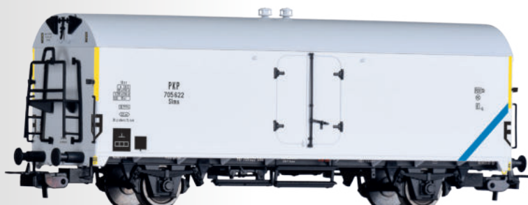
Kühlwagen SIma der PKP Refrigerator car SIma of the PKP