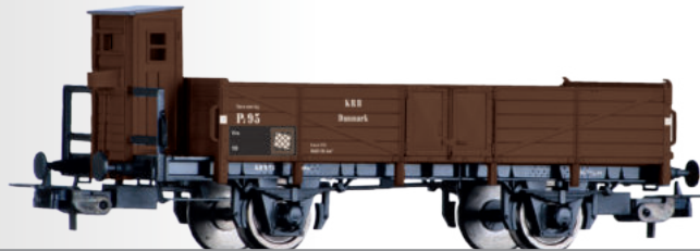
Offener Güterwagen PJ der Køge-Ringstet Banen (DK) Open car PJ der Køge-Ringstet Banen (DK)