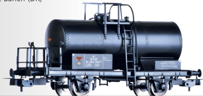
Kesselwagen ZE „A/S Luxol Kemiske Fabrikker“, eingestellt bei der DSB Tank car ZE „A/S Luxol Kemiske Fabrikker“ of the DSB