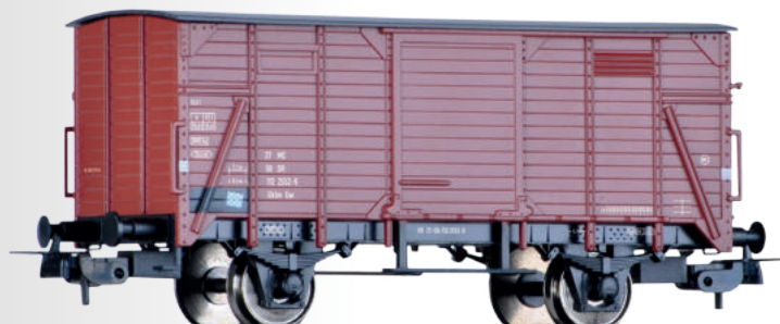
Gedeckter Güterwagen Gkml der DR Box car Gkml of the DR