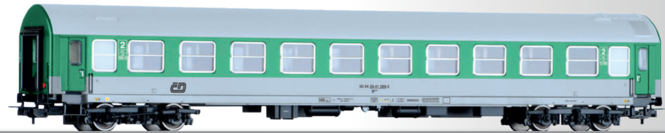
Reisezugwagen 2. Klasse B 250, Typ Y, der ČD 2nd class passenger coach B 250, type Y, of the ČD