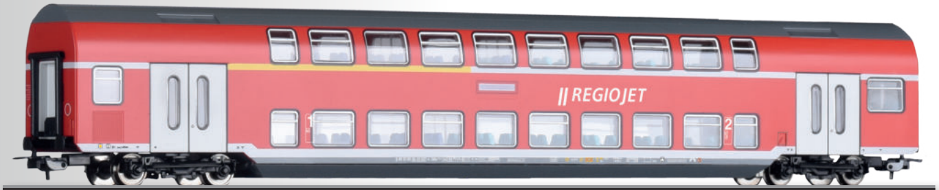
Doppelstockwagen 1./2. Klasse DABz755 der RegioJet 1st/2nd class double-deck coach DABz755 of the RegioJet