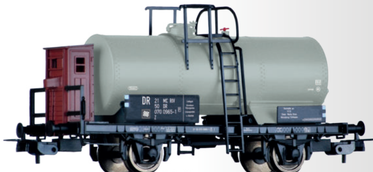
Kesselwagen Z der DR, vermietet an VEB Chemische Werke Buna Tank car Z "VEB Chemische Werke Buna" of the DR