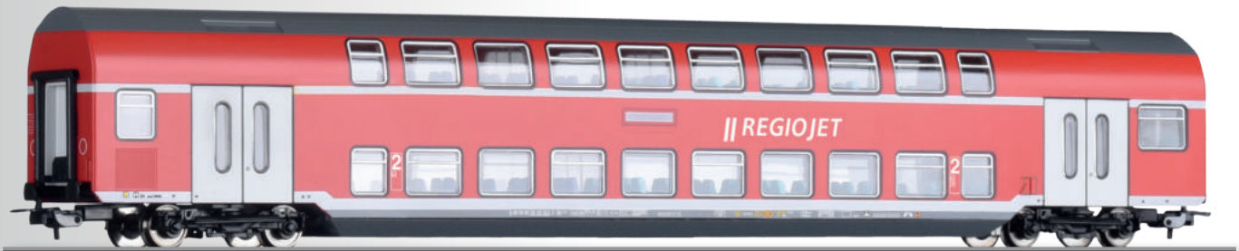
Doppelstockwagen 2. Klasse DBz750 der RegioJet 2nd class double-deck coach DBz750 der RegioJet