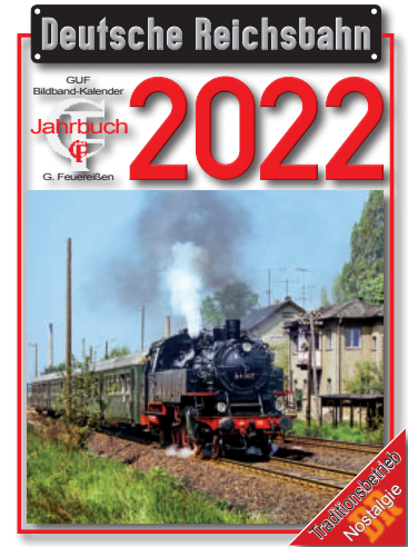
DR-Kalender 2022 DR calendar 2022 (Feuereisen Verlag)