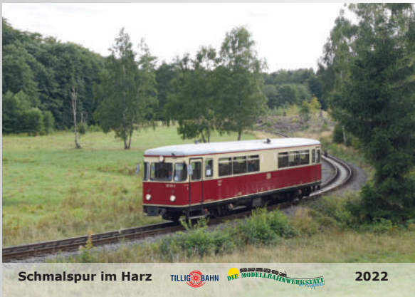
Schmalspur-Kalender 2022 Narrow-gauge calendar 2022