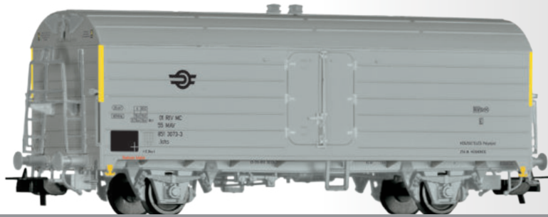
Kühlwagen Ichs der MAV Refrigerator car Ichs of the MAV