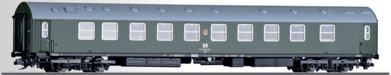
Abbildung zeigt TT-Modell

FORMNEUHEIT: Salon-Nachrichtenwagen der DR