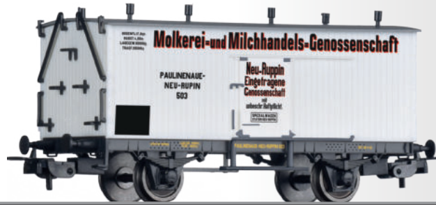
Kühlwagen der Molkerei- und Milchhandels-Genossenschaft Neu-Ruppin, eingestellt bei der Paulinenaue-Neuruppiner Eisenbahn (PNE) Refrigerator car of the Molkerei- und Milchhandels-Genossenschaft Neu-Ruppin, of the Paulinenaue-Neuruppiner Eisenbahn (PNE)