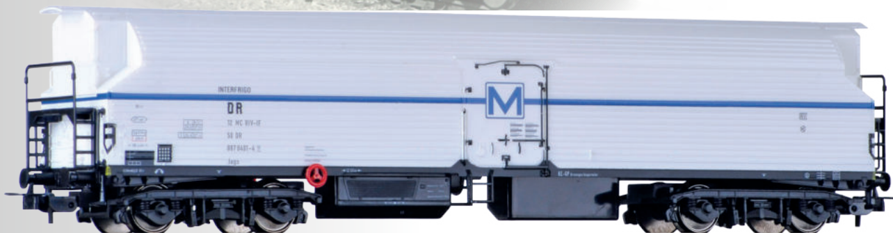
Maschinenkühlwagen „INTERFRIGO“ der DR Refrigerator car "INTERFRIGO" of the DR