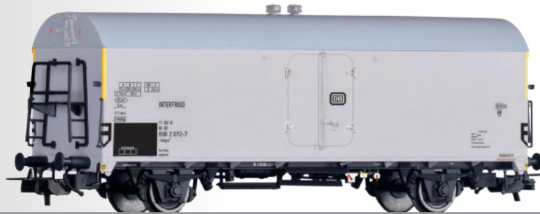
Kühlwagen Ichqrs 377 „INTERFRIGO“ der DB Refrigerator car Ichqrs 377 "INTERFRIGO" of the DB