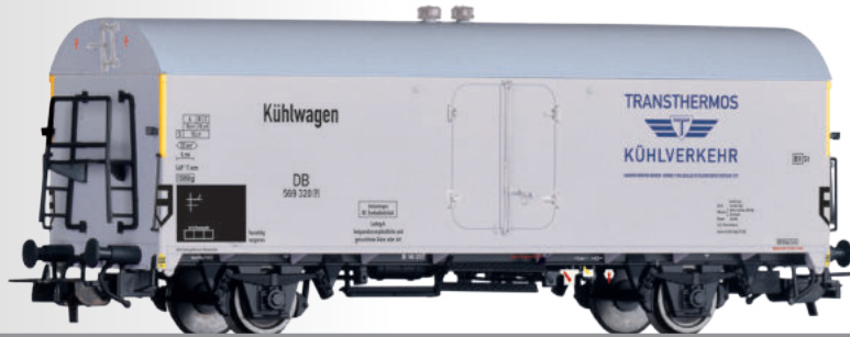
Kühlwagen „Transthermos Kühlverkehr“, eingestellt bei der DB Refrigerator car "Transthermos Kühlverkehr" of the DB