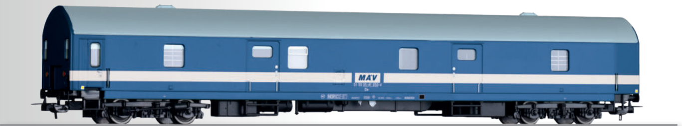
Gepäckwagen Da der MAV Baggage car Da of the MAV