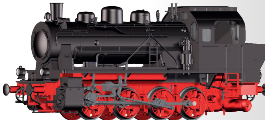
Dampflokomotive Nr. 4 der Hersfelder Kreisbahn Steam locomotive No. 4 of the Hersfelder Kreisbahn

Please note: All the following models are unique editions, last date of order: 31st march 2021