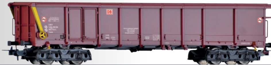
Rolldachwagen Taems der DB AG Sliding roof car Taems of the DB AG